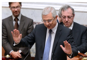
Le président Claude Bartolone, au « perchoir ».

Les élections municipales puis européennes du premier semestre 2014 ont apporté un fait inédit et peu anticipé dans la sphère politico-médiatique : l'arrivée en premier plan du Front national.