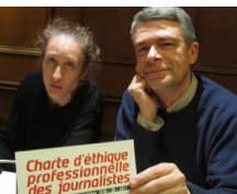
Au premier atelier, à Angers.