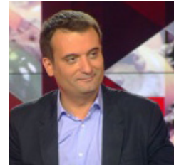
Florian Philippot, vice-président du FN.

et à l'agressivité journalistique dont ses dirigeants estiment avoir toujours été victimes ? En fait, le Front national est loin maintenant d'être le pestiféré de la classe politique et ses interventions dans les grands médias sont fréquentes. Le débat n'est toutefois pas clos au sein même de la profession. Il y a d'un côté ceux qui pensent que mettre en avant le FN en en parlant et en interrogeant ses leaders, ses militants et ses électeurs, est prendre un risque avec un parti « pas comme les autres », qui ne les a pas convaincus d'avoir réellement abandonné ses vieilles lunes racistes et antisémites, voire antidémocratiques et violentes. De l'autre, on trouve ceux qui estiment que le parti lepeniste joue le jeu de la démocratie, qu'il représente un sixième à un quart de la population selon les scrutins, que lui aussi a le droit d'exprimer ses options, que l'en empêcher lui donne des armes supplémentaires et que s'il doit être combattu c'est sur le plan idéologique et politique.