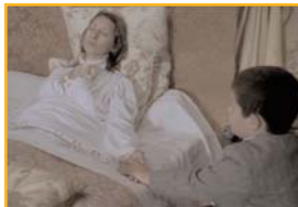
Photo 2 : Orson Welles