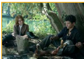
Photo 4 : Jean Renoir