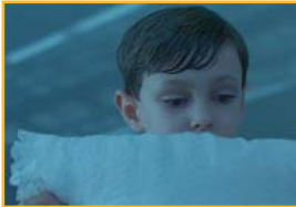
Photo 6 : Ingmar Bergman

• Éléments de réponse. Trois personnages à table, en noir et blanc. Décor cossu, vaisselle luxueuse, vêtements et maintiens guindés. La femme au regard sévère, cadrée par l'imposante cheminée, préside. L'homme semble ennuyé, interrogateur. L'enfant semble inquiet, triste.